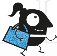
Sessione di meditazione